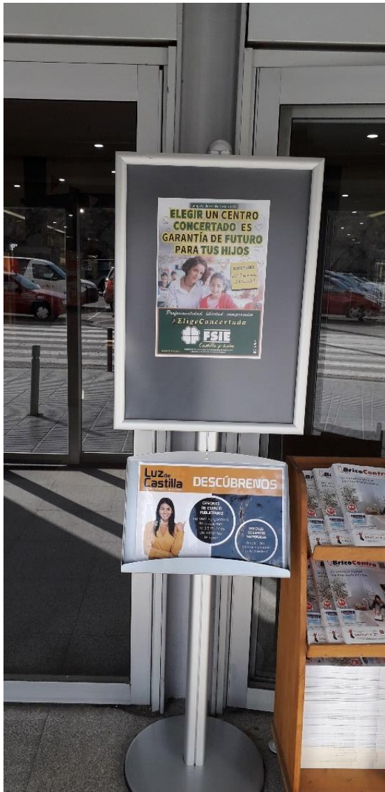
Centro comercial Luz de Castilla (entradas al mismo):