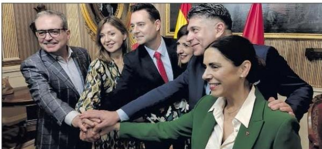
El alcalde y los portavoces municipales del PSOE, PP, Cs, Vox y Podemos visualizaron el día 15 “unidad de acción” en su reivindicación.

“Nos estamos jugando una posibilidad de desarrollo para nuestra ciudad que no podemos dejar escapar”